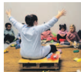
Alumnos en la escuela infantil de La Corredoria